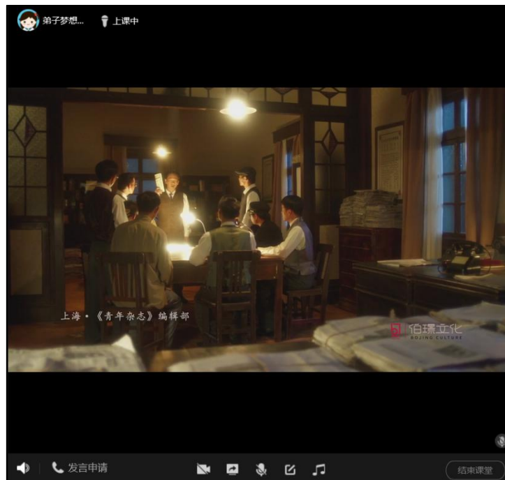
团队线上学习中国共产党成立的故事

传播者团队此次暑期社会实践以“重返觉醒年代，传播红色精神”为主题，集体走访嘉兴市、杭州市的红色革命基地，同时集体组织线上学习，重温建党历程，激活红色记忆，并在队员家乡所在地追溯当地红色革命的发源和发展史，了解当地红色故事，追溯马克思故乡德国特里尔的故事并进行双语的学习与传播，开展系列活动，重返当初红色精神觉醒的年代。