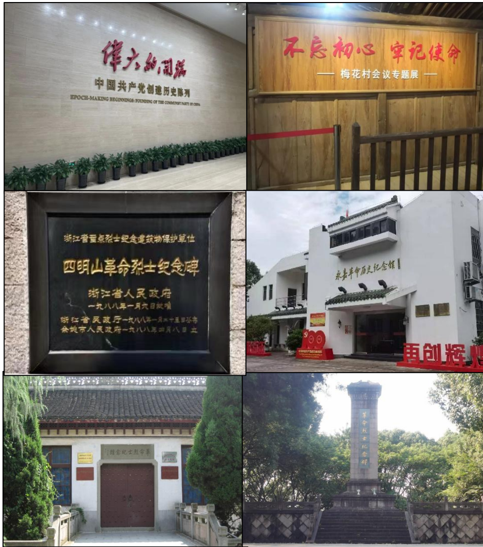
团队成员走访家乡红色基地