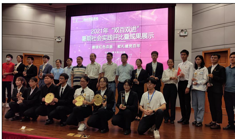
团队获得浙江科技学院2021年暑期社会实践优秀团队