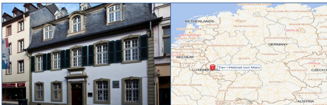
团队成员双语学习马克思在特里尔的故事