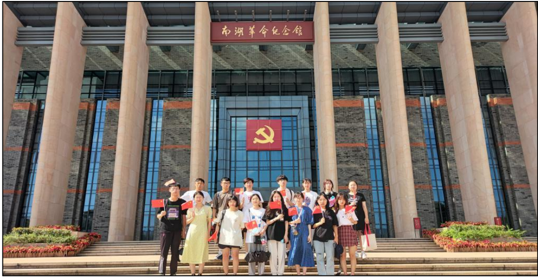
团队参观嘉兴南湖革命纪念馆