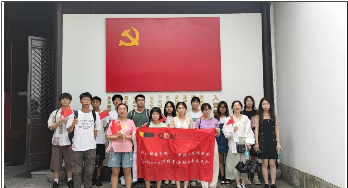
团队参观中共杭州小组纪念馆